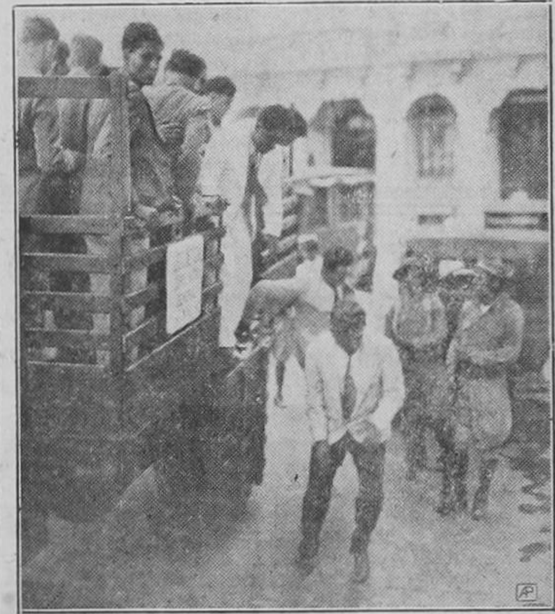
Miembros de la colonia nicaragüense regresando a San José, después de pasados los cinco días terribles de los festejos somoceros.