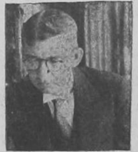
Fotografía de don León, furioso, porque Tacho estaba encantado con Calderón Guardia y a él no le hizo caso, a pesar de ser presidente.