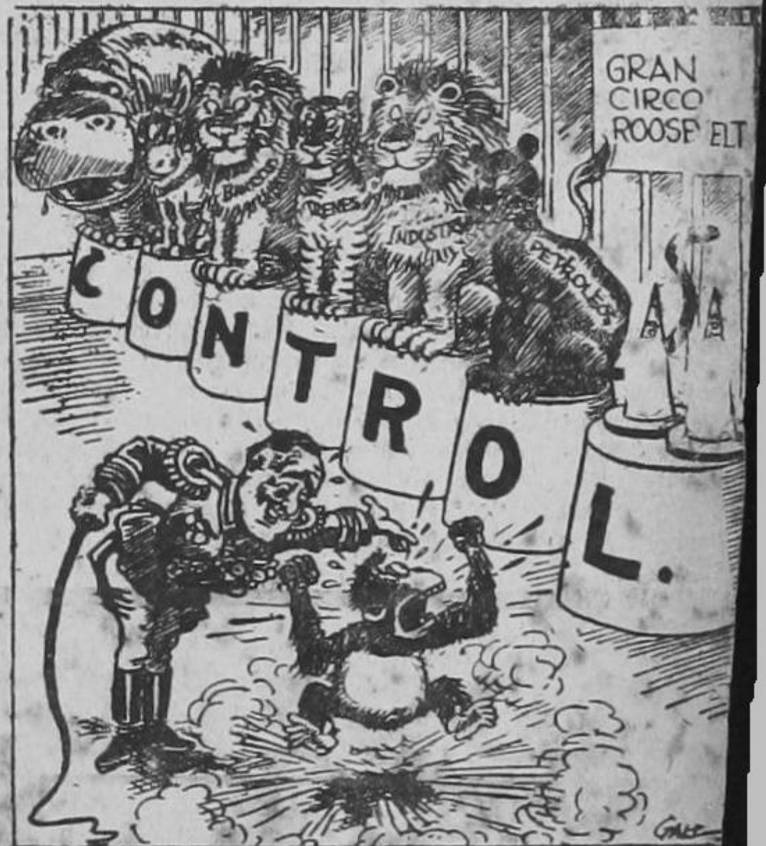
El domador (Roosevelt): Y déjate de bulle especulaciones con el canalito o te subo a ese quito junto con los otros, niño bobo!