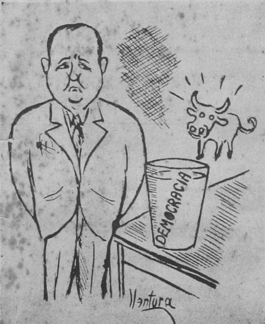
El general: Vaya puej, a mí no me cuadra ejte vasito; prefiero el pinolillo de mi tierra o un buen trago de wisky.

«El señor Presidente de la República obsequió al General Somoza con un vaso de leche ordeñada por sus propias manos».