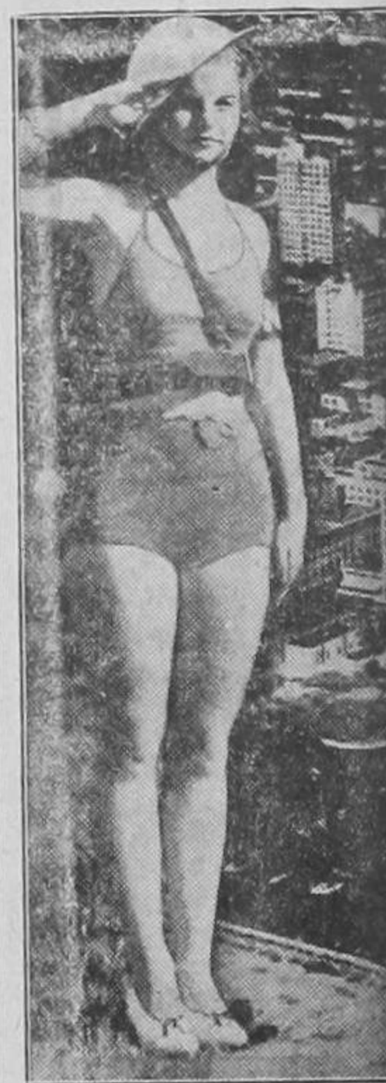
Como recibieron las jóvenes de la sociedad josefina al general Somoza según el periodista Gabry Rivas.